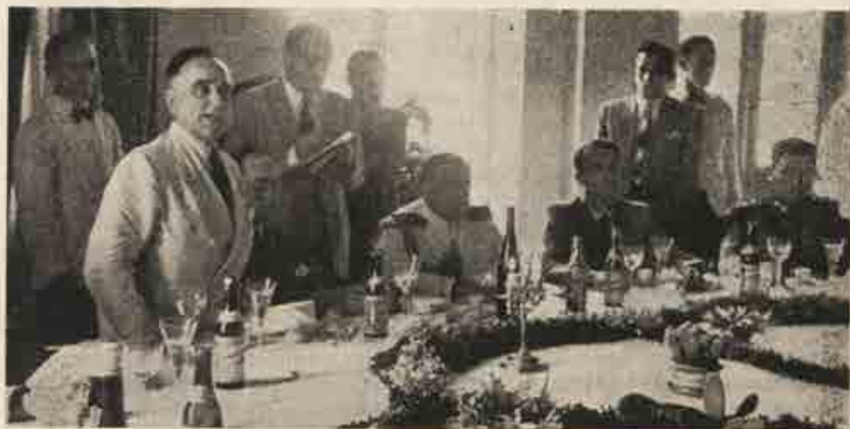
Fotografia tomada por ocasião da visita do presidente Vargas a Blumenau, em 1940, durante o banquete de 600 talheres que lhe foi oferecido no Teatro Carlos Gomes.