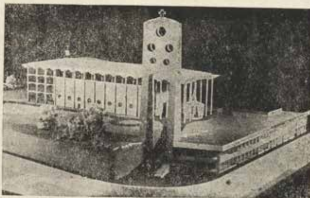
A nova Igreja Matriz de Blumenau, que será sagrada a 25 de janeiro próximo.

O novo templo paroquial de Blumenau é um monumento digno de ser visto. Planejado e executado dentro das normas da mais moderna técnica no gênero, não tem complicações arquitetônicas.